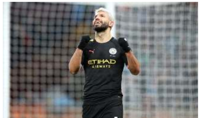
Sergio Aguero a inscrit un triplé, le serial buteur cityzen détient deux nouveaux records.