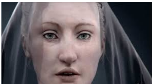
Reconstitution du visage d'Agnès Sorel grâce à Philippe Charlier, anthropologue

Elle meurt le 9 février 1450 à la suite d'un flux de ventre, alors qu'elle est enceinte.