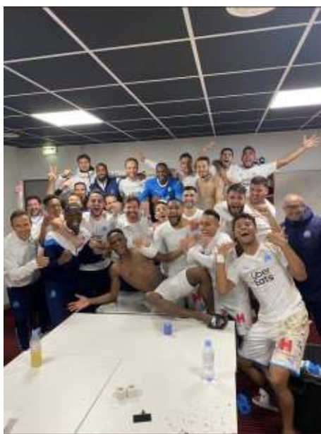
Les Marseillais dans le vestiaire, célébrant leur victoire contre Rennes.