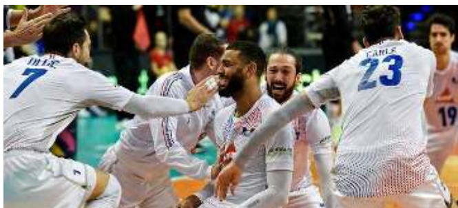
Les Bleus ont pu fêter dignement leur victoire et leur qualification pour les JO cet été.

L'Équipe de France, au terme du tournoi de qualification olympique, s'est qualifiée pour les Jeux Olympiques de Tokyo cet été. Cette qualification a été permise grâce à la victoire face à l'Allemagne en finale du tournoi, en trois sets : 25-20 / 25-20 / 25-23.