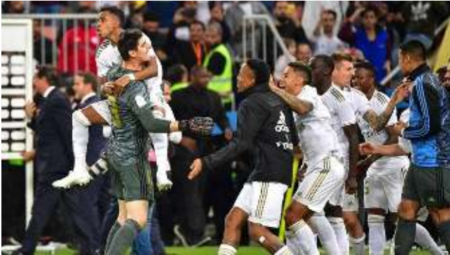
Les joueurs du Real Madrid sautent sur Thibaut Courtois après leur victoire aux tirs au but contre leur rival de l'Atletico.

n'en ont raté aucun. Un seul tir au but a été inscrit pour l'Atletico, celui du latéral Trippier. Sergio Ramos, le capitaine, a inscrit le penalty de la victoire, 4-1. C'est la 11 ème Supercoupe d'Espagne remportée par le Real Madrid, la dernière ayant été gagnée en 2017.