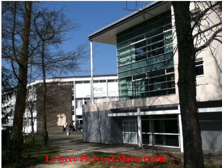
Le lycée Pierre et Marie Curie