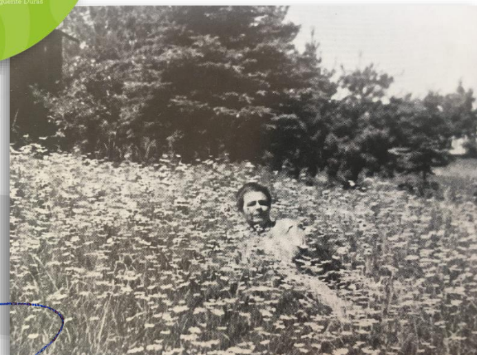
Marguerite Yourcenar dans les Marguerites Île des Monts Déserts, où elle vivra pendant 50 ans.